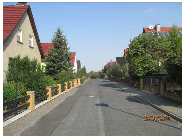
Vorhandene Bebauung entlang der Ernst-Thälmann-Str.

Mit der Satzung soll eine geordnete städtebauliche Entwicklung ermöglicht und Voraussetzungen für eine gestalterisch sinnvolle Ausprägung des Ortsrandes in diesem Bereich von Lampertswalde geschaffen werden, um den Bauflächenbedarf in der Gemeinde Lampertswalde zu decken. Ziel der Satzung ist es, das Baurecht für Wohnbebauung zu schaffen.