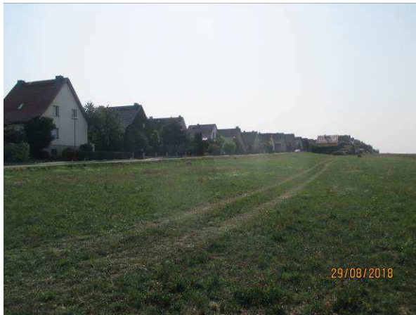
Blick auf das Plangebiet entlang der Ernst-Thälmann-Str.

Ziel der Satzung ist es, die vorhandene Bebauung entlang der Ernst-Thälmann-Straße durch Einbeziehung der Außenbereichsflächen in die im Zusammenhang bebaute Ortslage zu ergänzen. Durch die Ergänzung des unbeplanten Innenbereichs um diese Außenbereichsflurstücke wird die Abrundung des Ortsrandes in diesem Bereich bezweckt.