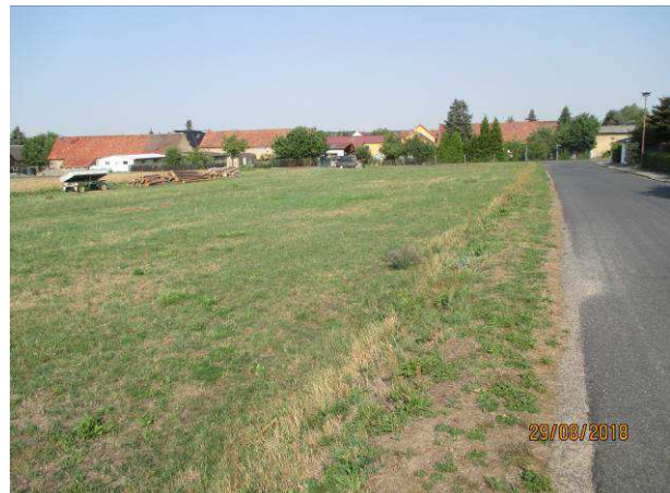
Blick auf das Plangebiet auf der rechten Bildseite die Ernst-Thälmann-Straße

Als Maßnahme zum Ausgleich erheblicher Eingriffe in Natur und Landschaft wird außerhalb des Geltungsbereichs der Ergänzungssatzung eine Baumreihe (Gesamtfläche ca. 1,4 ha davon Maßnahmenfläche ca. 0,1 ha) zur Gliederung der freien Landschaft angelegt bzw. ergänzt.