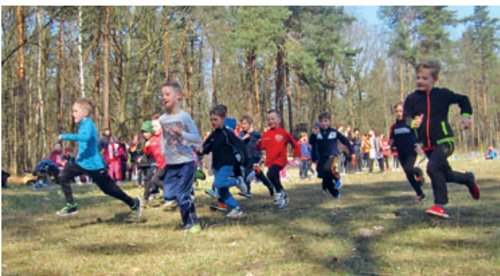
Start Klasse 1 Jungen beim Schulcrosslauf